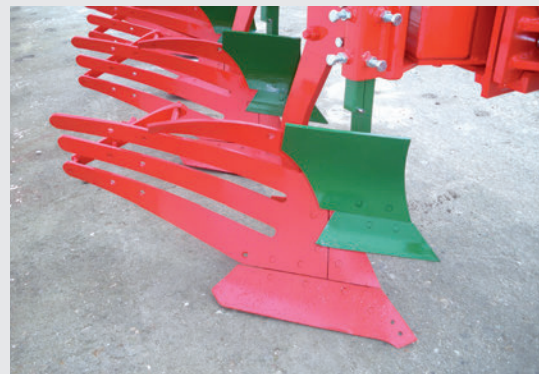
Rasetas / Vertedera de láminas.