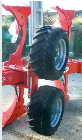
Rueda de control doble adelantada.