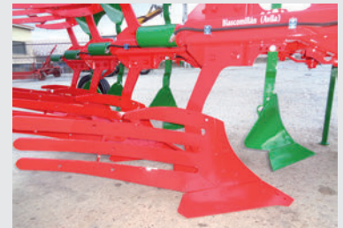
Rasetas / Vertedera de láminas.