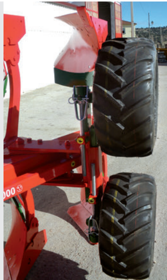
Rueda de control doble adelantada.